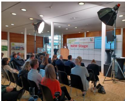
Konferenz auf der Messe LIGNA am 16.05.2023