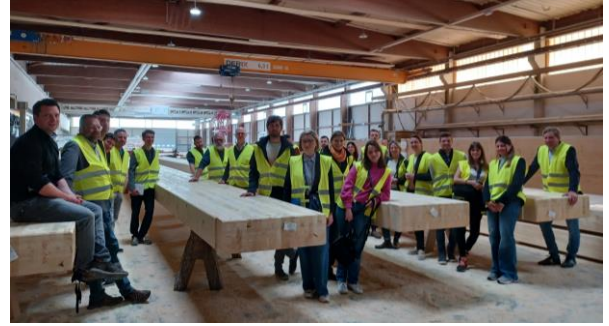
Besuch des BSP-Herstellers DELX in Niederkrüchten am 15.05.2023