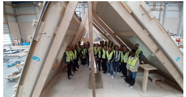
Besuch des Holzrahmenbauerstellers Terhalle in Ahaus am 17.05.2023