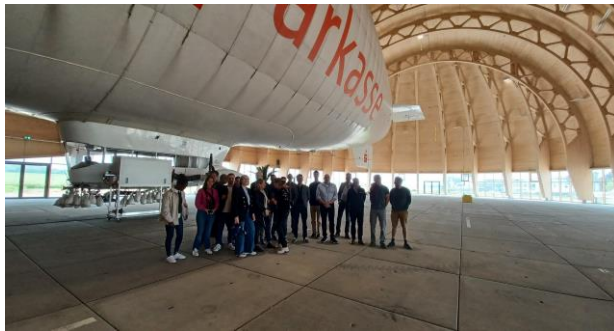
Besuch der Luftschiffhalle in Mühlheim an der Ruhr am 15.05.2023