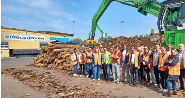
Besuch des Sägewerks Eigelshoven in Würselen am 15.05.2023