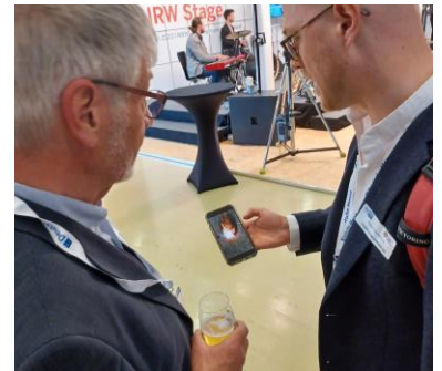
Netzwerken auf der Messe LIGNA am 16.05.2023