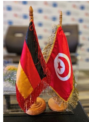
2) Briefing und Fachkonferenz