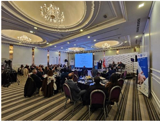
1) Unternehmenspräsentationen auf der Fachkonferenz