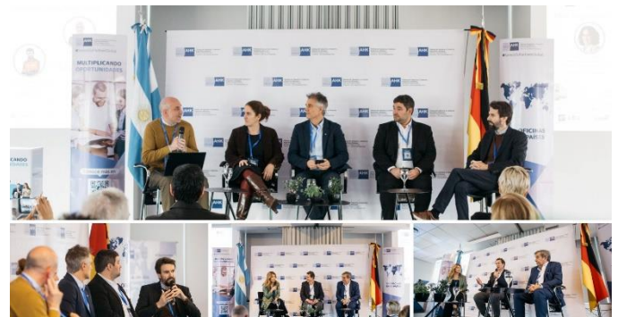
Podiumsdiskussionen, Präsentationsveranstaltung