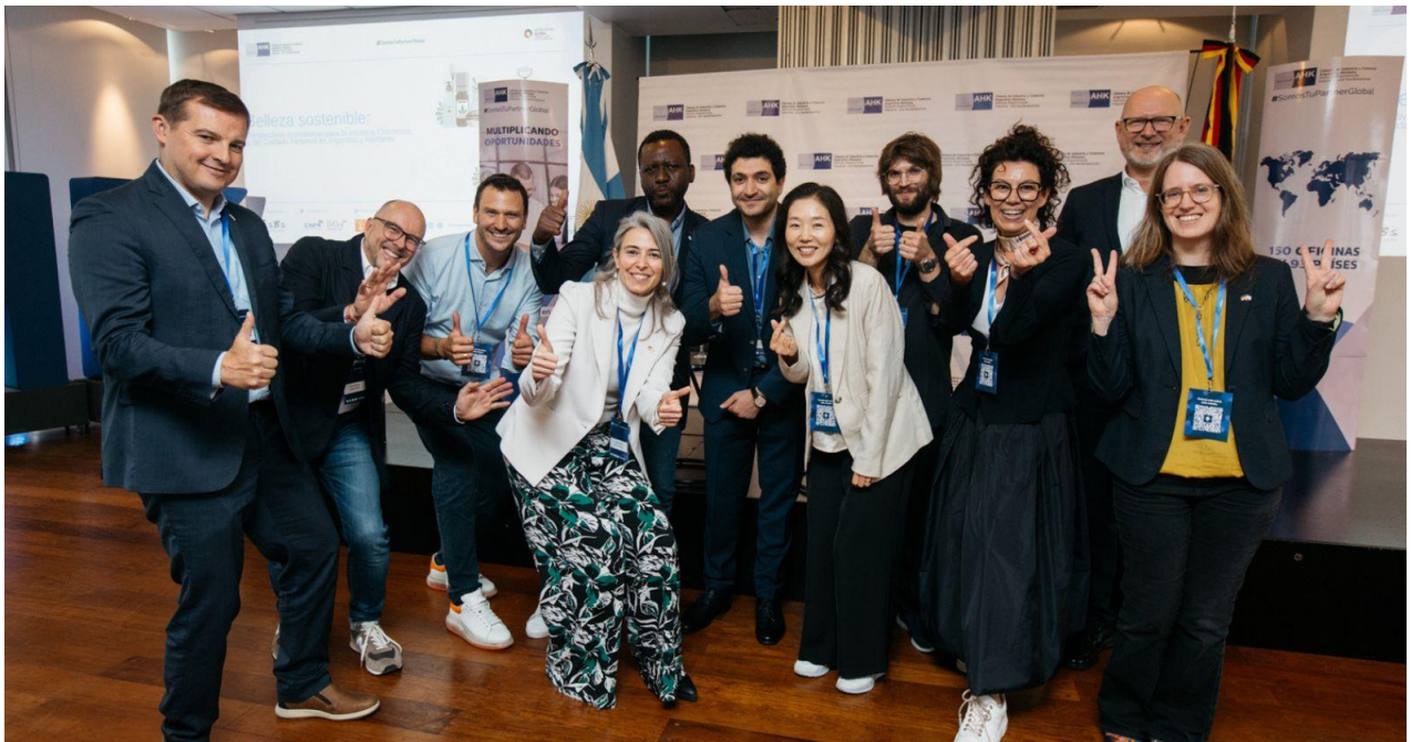
Delegation, Präsentationsveranstaltung