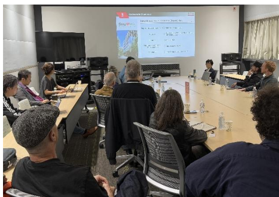
Bild 4: Gruppenbesuch bei SONY Music Japan am 20.10.2025