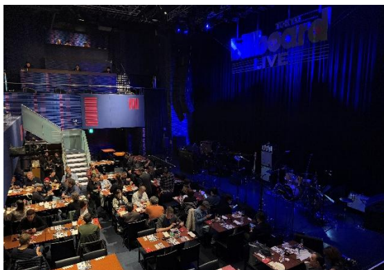
Bild 5: Meeting mit Billboard Live Tokyo und Konzert am 22.10.2025

Das Projekt wurde im Auftrag des Bundesministeriums für Wirtschaft und Energie (BMWE) durchgeführt. Es handelt sich dabei um eine projektbezogene Fördermaßnahme im Rahmen des Markterschließungsprogramms für KMU .