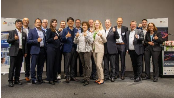
1. Präsentationsveranstaltung Gruppenfoto in Taipei