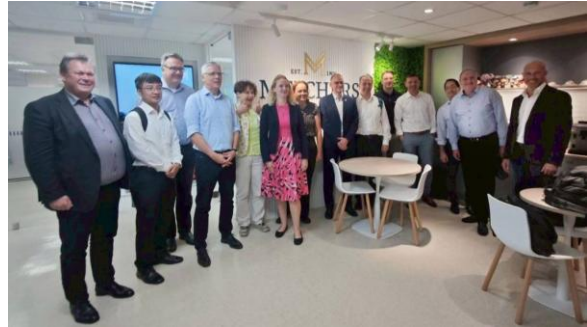
2. Gruppenbesuch bei Melchers Trading GmbH (Taiwan Branch)