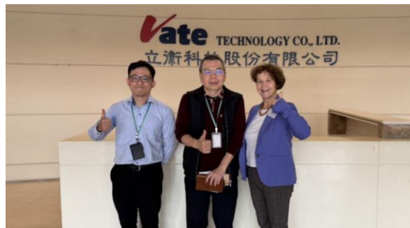
4. B2B Meeting bei Vate Technology Co., Ltd.