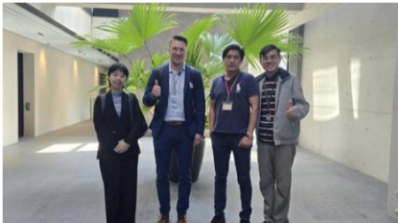
5. B2B Meeting bei Swiroc Corp.