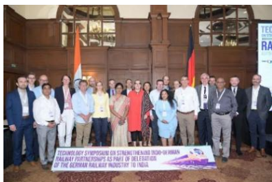
Bild 3 Geschäftsanbahnung Teil 1