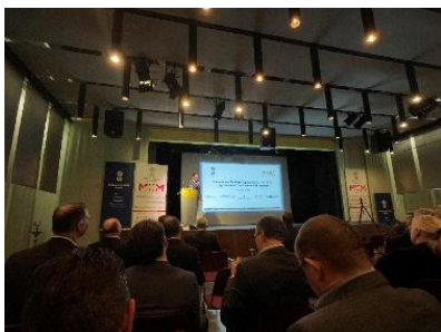
Bild 1 Informationsveranstaltung