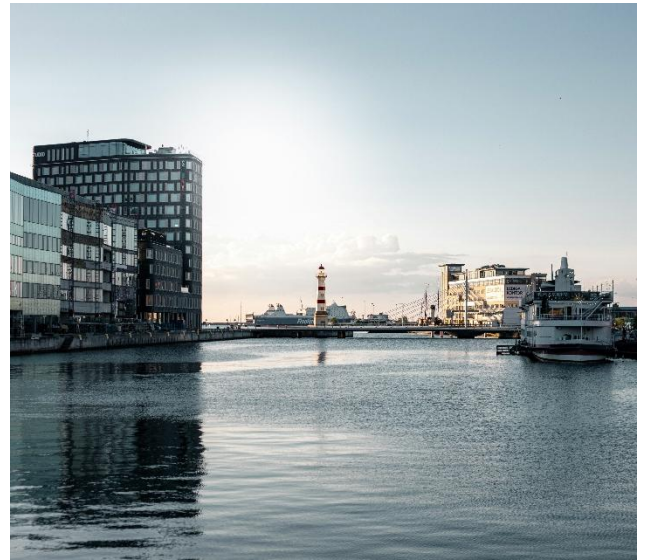
Blick auf den Leuchtturm Inre Fyr im Hafen Malmö

Generell wird dem Mobilitätssektor in Schweden, aufgrund seiner Bedeutung für BIP und Wertschöpfung, ein hoher Stellenwert auf dem Weg hin zur Klimaneutralität zugeschrieben. Zudem weist die schwedische Leichtbauagenda darauf hin, dass beispielsweise die Luftfahrtindustrie das Gewicht von Flugzeugen und Flugzeugkomponenten jedes zehnte Jahr um mindestens zehn Prozent verringern muss, um die gesetzten Ziele zu erreichen. Auch in den Marktsegmenten Fahrzeugbau und Schiffbau gilt es die Energieeffizienz zu optimieren, um konkurrenzfähig zu bleiben und vorgegebene Emissionsgrenzen einzuhalten. In der aktuellen schwedischen Leichtbauagenda wird hervorgehoben, dass Schwedens Initiativen im Bereich Leichtbau entscheidend dafür sind, dass Nachhaltigkeitsziele erreicht, Konkurrenzkraft gestärkt und Arbeitsplätze im eigenen Land geschaffen werden.