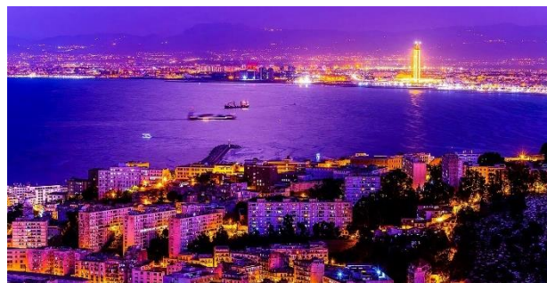
Foto „Stadt, Bucht, Nacht“ von pdpics auf Pixabay, Lizenz: Pixabay License URL: https://pixabay.com/de/photos/stadt-bucht-nacht-panorama-meer-5903274/

Der Ausbau der Automobilindustrie in Algerien eröffnet deutschen Unternehmen attraktive Geschäftschancen entlang der gesamten Wertschöpfungskette. Insbesondere im Bereich Fahrzeugproduktion und Montage bestehen Potenziale beim Aufbau lokaler Montagewerke, der Lieferung moderner Fertigungs-, Automatisierungs- und Robotik Technik sowie bei Joint Ventures und Technologiepartnerschaften mit lokalen