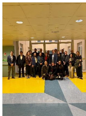
Abbildung 2: Besuch im Policlinico Modena