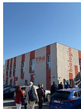
Abbildung 3: Besuch im Tecnopolo Mirandola (AHK Italien)