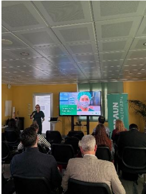
Abbildung 4: Gruppentermin bei B. Braun Avitum Italy (AHK Italien)