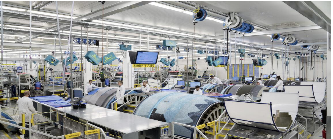
Fertigung von Triebwerkkomponenten für die Luftfahrtindustrie

Vom 14.09. bis zum 18.09.2026 führt AHK USA-Atlanta in Zusammenarbeit mit SBS systems for business solutions GmbH, im Auftrag des Bundesministeriums für Wirtschaft und Energie (BMWE), eine Geschäftsanhahnungsreise in die USA durch. Es handelt sich dabei um eine projektbezogene Fördermaßnahme im Rahmen des Markterschließungsprogramms für KMU. Zielgruppe sind vorwiegend kleine und mittlere deutsche Unternehmen.