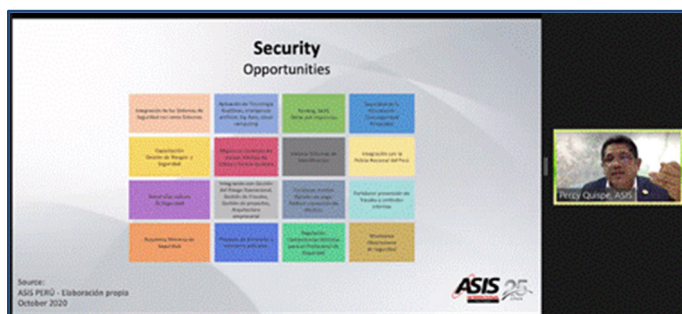
Screenshot der Keynote zu Peru

Am 20. und 29. Oktober 2020 führte die econAN international GmbH, im Auftrag des Bundesministeriums für Wirtschaft und Energie (BMWi), zwei digitale Informationsveranstaltungen zum chilenischen und peruanischen Markt durch. Es handelte sich dabei um eine projektbezogene Fördermaßnahme im Rahmen des BMWi-Markterschließungsprogramms für KMU (kleine und mittlere Unternehmen). Sie ist Bestandteil der Exportinitiative zivile Sicherheitstechnologien und -dienstleistungen. Die Veranstaltungen waren als einzelne Präsenz-Veranstaltung mit einem entsprechenden Programmablauf geplant worden. Da die aktuelle Situation und die Auswirkungen der globalen Corona-Krise eine physische Durchführung der Informationsveranstaltung nicht zuließen, wurde kurzfristig auf eine digitale Durchführung umgestellt. Um beiden Märkten ausreichend Raum zu geben, wurde für jedes Land eine eigene Veranstaltung organisiert. Kooperationspartner waren die Auslandshandelskammer Chile (AHK Chile), Auslandshandelskammer Peru (AHK Peru) und die Fachverbände ASW, BHE, BDSW und TeleTrust.